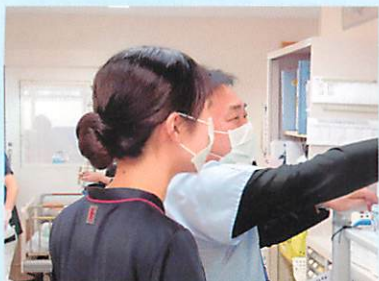
医師にもコミュニケーションがとりやすい環境

主な診療科は循環器内科、眼科、皮膚科です。循環器内科では、心不全療養指導士4名を筆頭に、どのスタッフも心不全の発症・重症化予防のための心不全療養指導ができるようにしています。また、心不全アドバンスケアプランニングにも取り組んでおり、患者さんやご家族の意向に沿った支援に取り組んでいます。眼科、皮膚科では手術もあり、慢性疾患から周術期まで多岐に渡って関わることができる病棟です。ワークライフバランスを重視し、働きやすい職場環境への配慮も行っています。