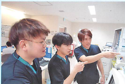
スタッフみんなで患者さんの情報共有、業務の進捗状況を確認