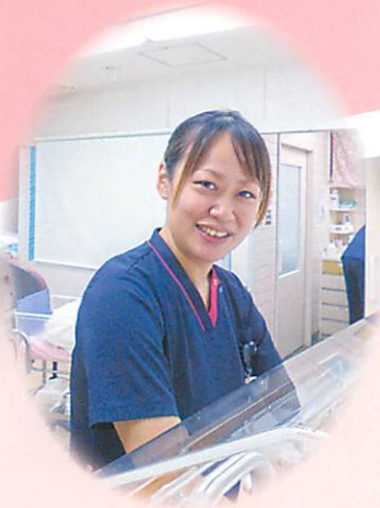
赤ちゃんがかわいく、毎日癒されています