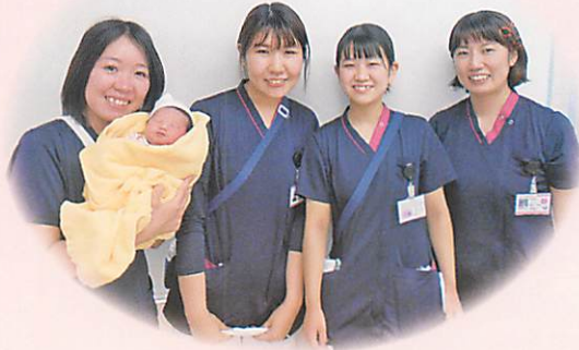
過去3年間の分娩件数