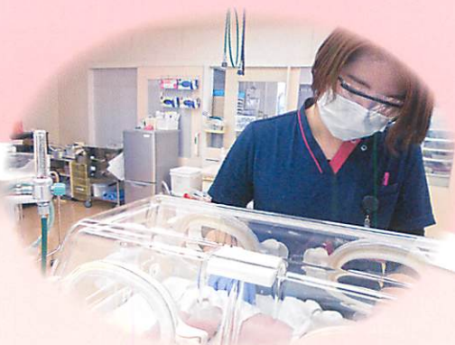
帝王切開後の赤ちゃんの観察です