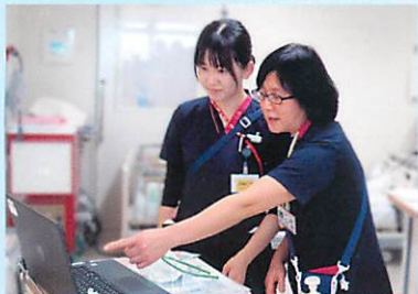
パートナーとその日の受持ち患者さんの情報、1日の予定を確認

主な診療科は循環器内科、眼科、皮膚科です。循環器内科では、心不全療養指導士4名を筆頭に、どのスタッフも心不全の発症・重症化予防のための心不全療養指導ができるようにしています。また、心不全アドバンスケアプランニングにも取り組んでおり、患者さんやご家族の意向に沿った支援に取り組んでいます。眼科、皮膚科では手術もあり、慢性疾患から周術期まで多岐に渡って関わることができる病棟です。ワークライフバランスを重視し、働きやすい職場環境への配慮も行っています。