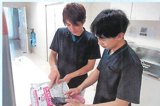
パートナーと一緒に点滴・確認