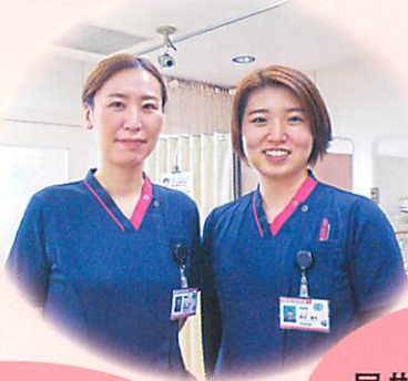
同期で頑張っています